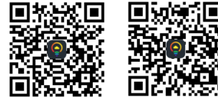
工程版安装二维码 用户版安装二维码